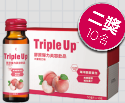
膠原彈力美容飲品