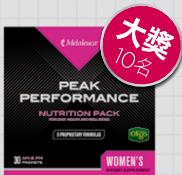
活力巔峰營養隨身包